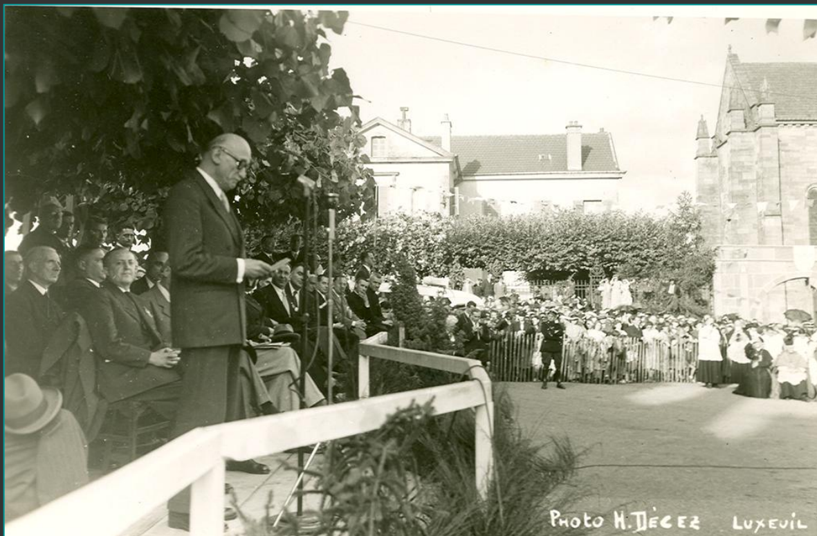
La tribune des autorités civiles face aux autorités religieuses lors de l'inauguration internationale de la statue de Saint-Colomban réalisée par le sculpteur C. Grange . Discours de M. le ministre Robert Schumann