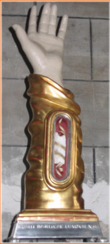
Le reliquaire de Saint Gall