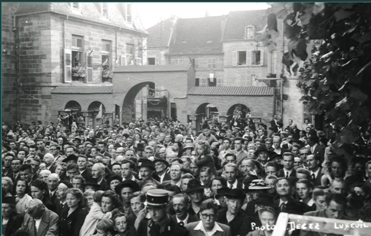
La foule sur la place St-Pierre avec un décor en bois, à l'entrée de la place, lors de l'inauguration internationale de la statue de St Colomban, le dimanche après midi 23 juillet 1950.