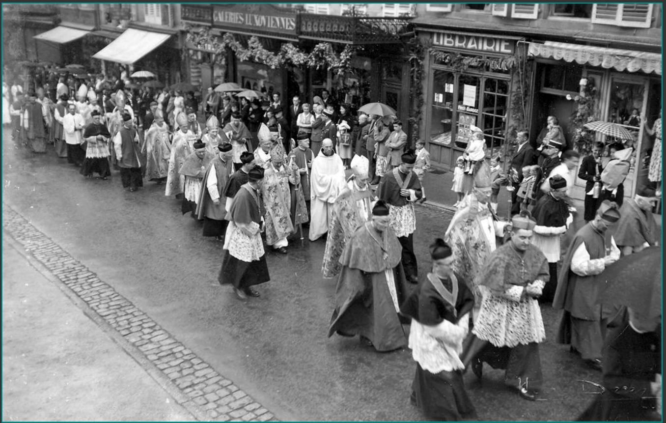
Après la remise de la relique de StGall, l'assemblée s'est rendue en procession à la Basilique pour la célébration. Cette photo a été prise à la hauteur de la place de l'Abbaye (Librairie Pinot)