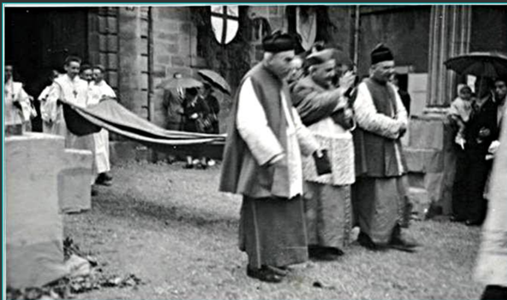
La procession à la sortie du Séminaire; on peut remarquer qu'un décor en bois recouvert de stuc avait été installé devant l'entrée du petit séminaire.