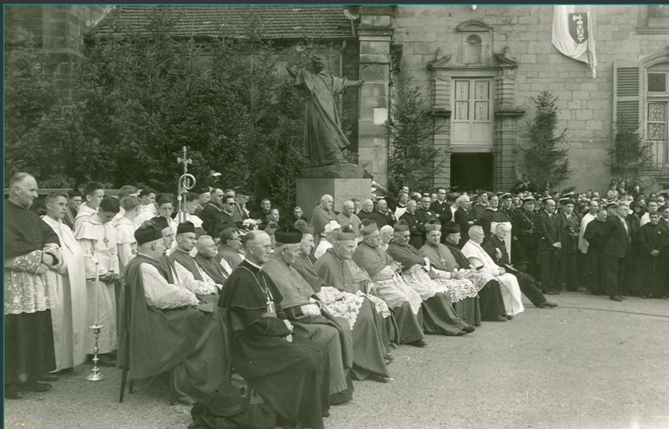
Les autorités religieuses lors de l'inauguration de la statue en fin d'après midi (à noter le comportement un peu assoupi des principaux protagonistes )