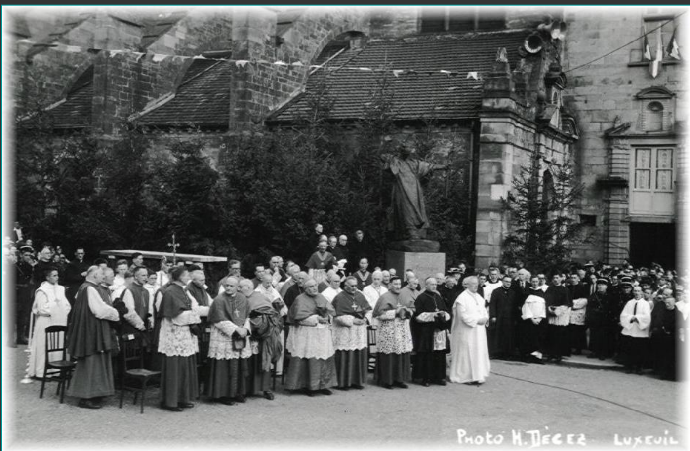
La place Saint Pierre était décorée d'une multitude de sapins.